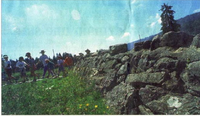
En balade du côté de Saint-Cergue et de la Givrine.