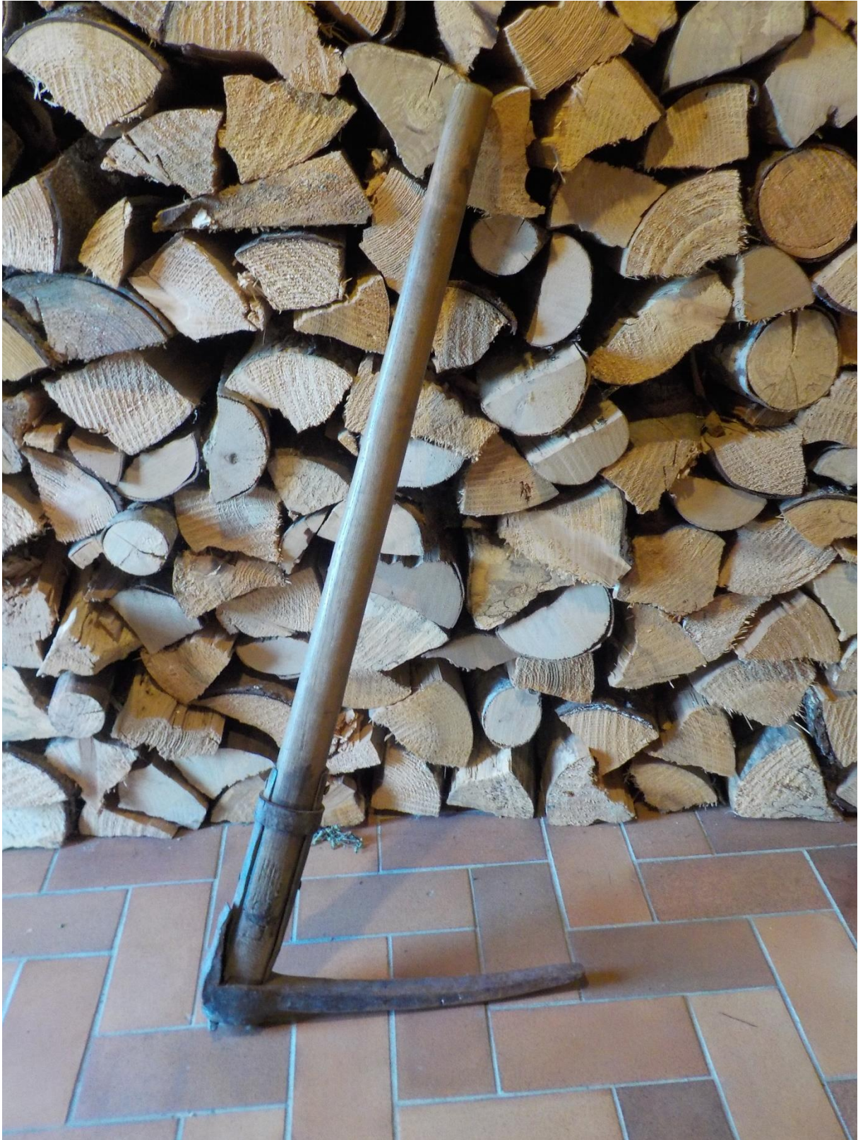
Notre fameux pic à gentiane, avec tous ses attributs métalliques.