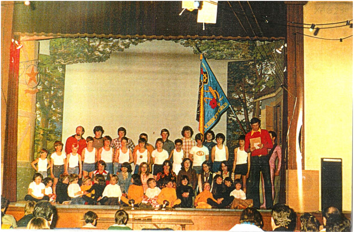
Ils présentent leur équipe parfois en un discours fleuve.