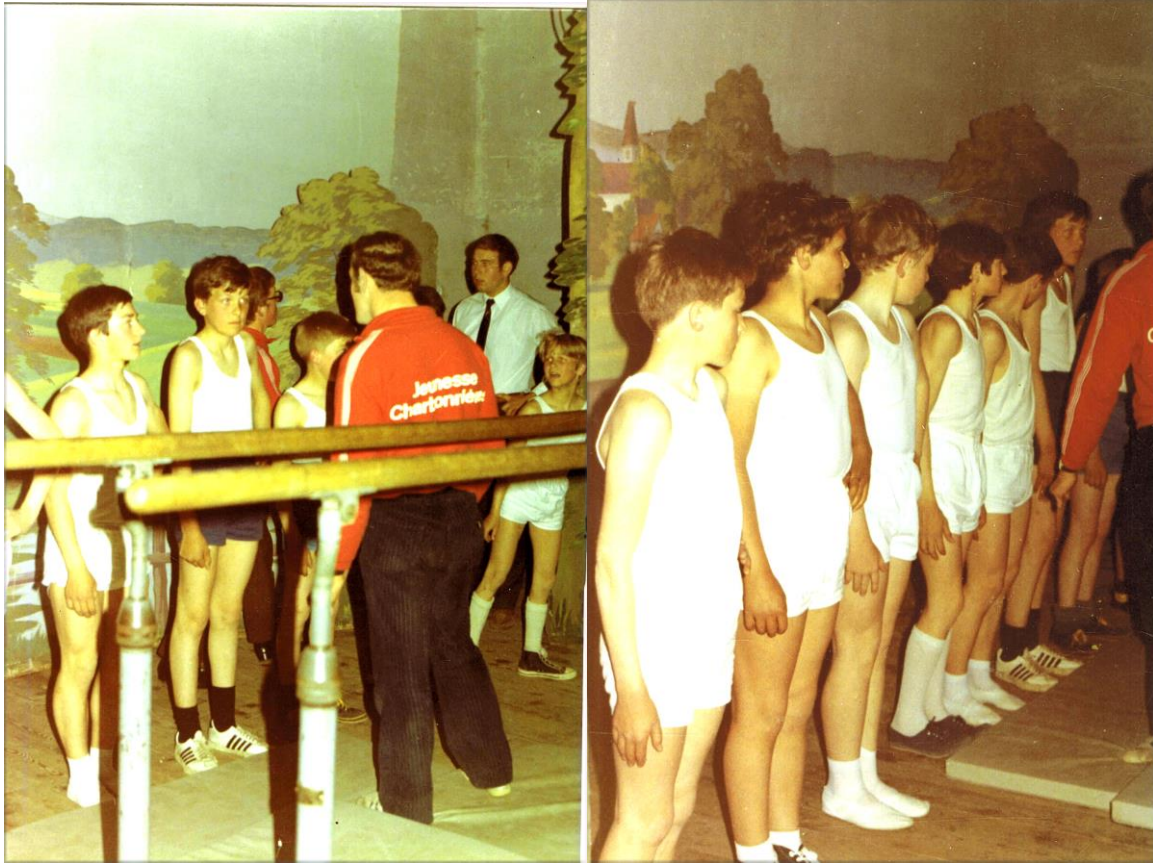
L'essentiel de l'activité a trait à la soirée annuelle, avec la participation non seulement des membres mais aussi des plus jeunes.