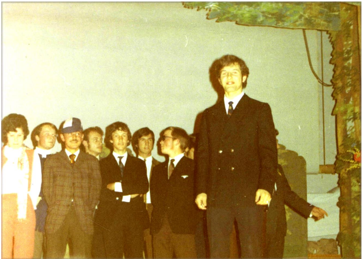
Les présidents prennent leur tâche au sérieux.