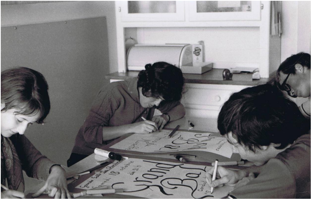
On se réunit pour confectionner des affiches.