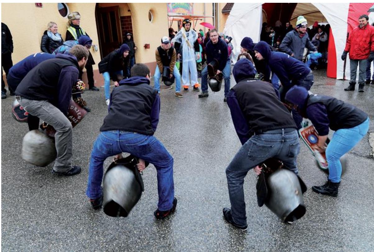
Les sonneurs de cloches de la jeunesse des Charbonnières.