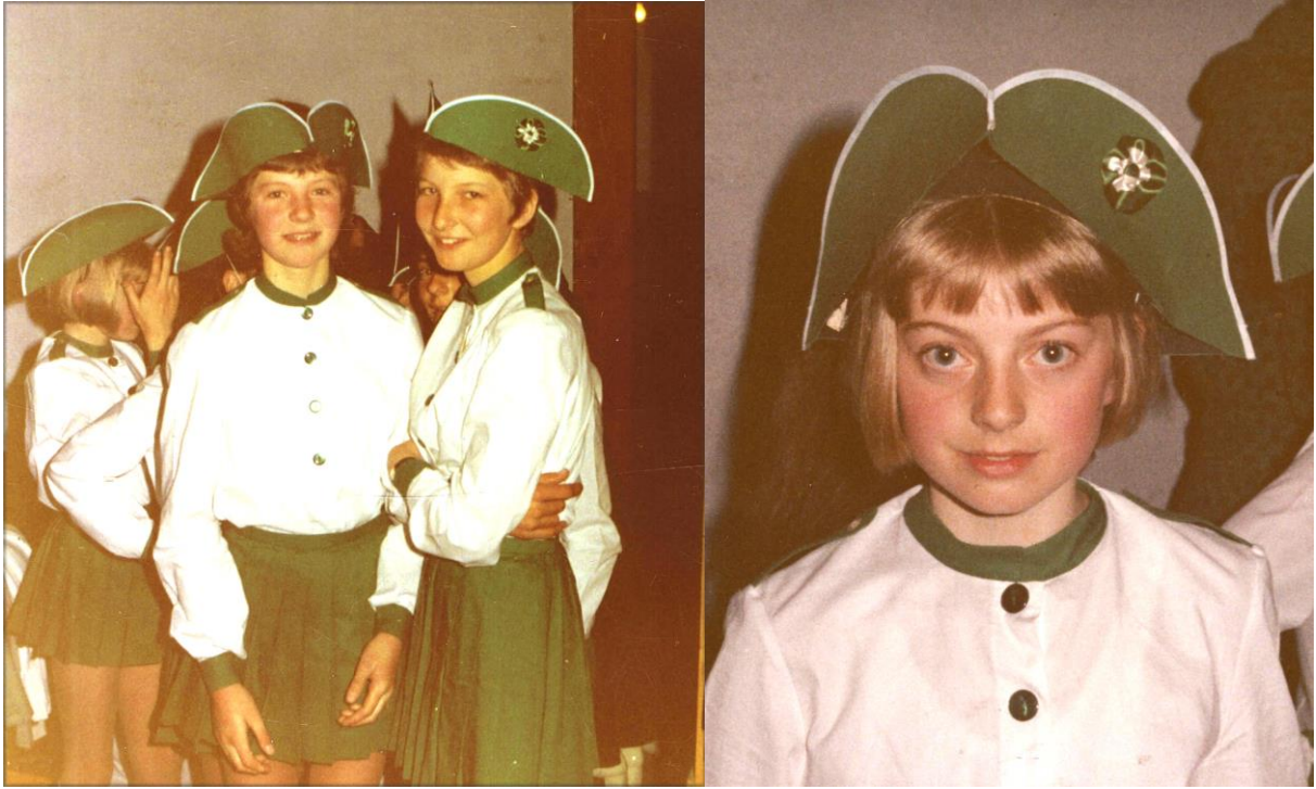
Les fillettes sont aussi de la partie.