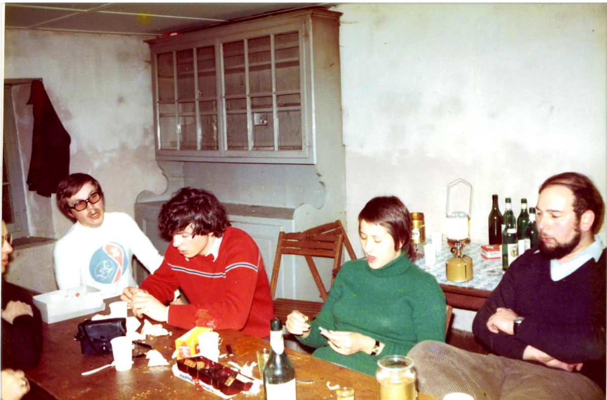
On peut se retrouver à l'occasion d'une petite raclette ou fondue. .