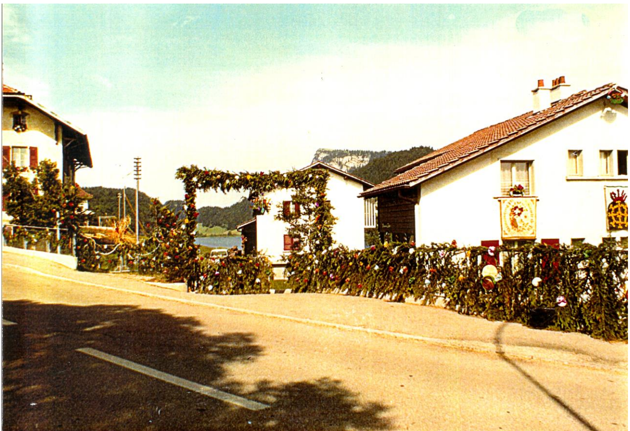
Une société capable d'organiser un Giron des jeunesses campagnardes, organisation à laquelle elle adhère.