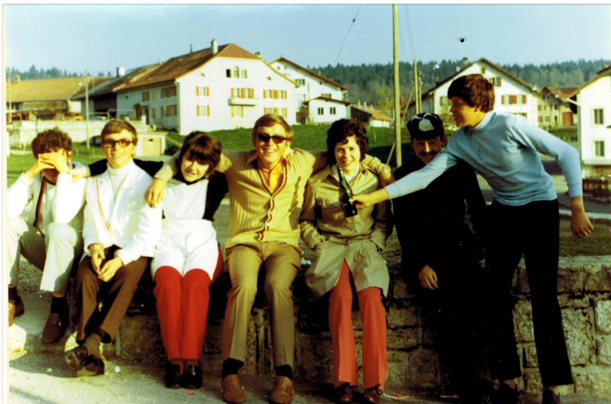
On se retrouve devant le local ou Grande salle. Ne la cherchez pas, elle n'existe plus !